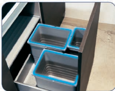
Nicht passendes Zubehör

Als Prüftool für Küchenplanungen hat die SHD AG mit „KPS protect“ einen Service mit vielen Vorteilen entwickelt.